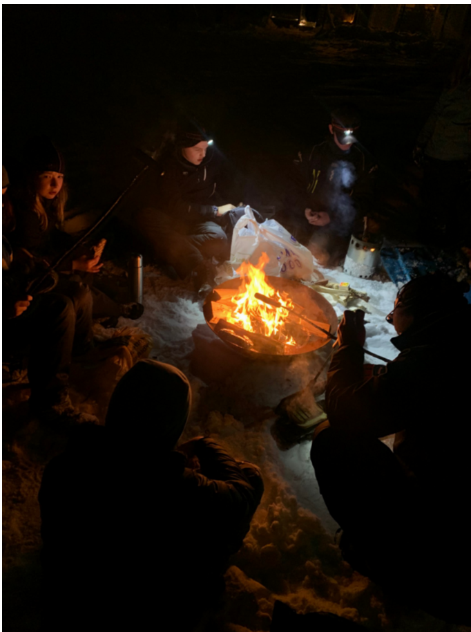
Utemøte hos Bremnes- speidarane vinter 2021