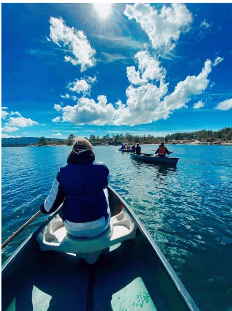
Fitjarspeidarane på kanotur